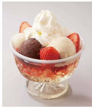
■苺白玉クリームあんみつ

フワフワの削り氷の上にかかったマスカルポーネのクリーミーなエスプーマが新食感です。ほうじ茶の程よい苦味とクリームのおまけがバランスよく調和しています。オプションで白玉がトッピングできます。