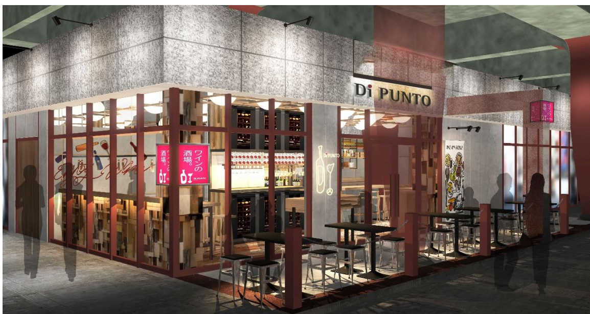
ワインの酒場。Di PUNTO 高円寺店の外観

株式会社プロントコーポレーション（本社：東京都港区、代表取締役社長：竹村典彦）は、3月31日（金）に「ワインの酒場。Di PUNTO 高円寺店（以下、ディプント）」をオープンいたします。