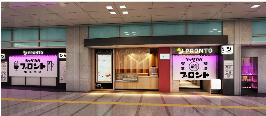
昼はカフェ、夜はサカバ。PRONTO 名古屋駅店の外観イメージ