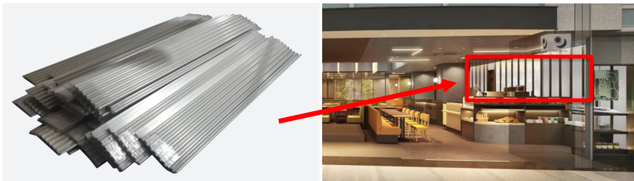
新幹線再生アルミと新幹線再生アルミを使用しているPRONTO 名古屋駅店の内観イメージ

今回、店内の一部で新幹線再生アルミを有効活用し、サステナブルな未来につながる新店舗を名古屋駅にオープン。新幹線再生アルミの店内利用は、現役引退した東海道新幹線車両アルミの利活用を推進する東海旅客鉄道株式会社とSDGsにおけるサステナブルな社会作りを目指し、2010年から10年以上「P LOVE GREEN」活動*をしているプロントコーポレーションが環境配慮の視点でお互いに賛同したことで実現いたしました。なお、新幹線再生アルミはジェイアール東海商事株式会社が製造・販売しています。