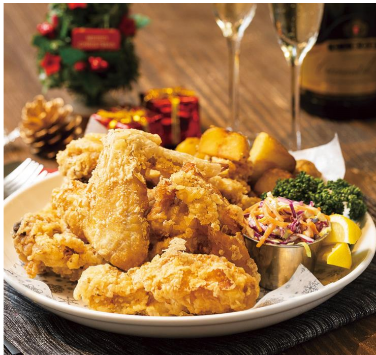
クリスマスチキン BOX 2,315円（税込 2500円）

プロントコーポレーションが運営し、Pasture Management Inc.（本社：米国ニューヨーク州ブルックリン/代表取締役社長：ジョージ・ウェルド）が展開する「egg 東京」（以下 egg）は、12月1日～25日まで、期間限定クリスマスチキンBOXを販売致します。