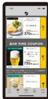
【POINT2】 特典クーポンを もらえる