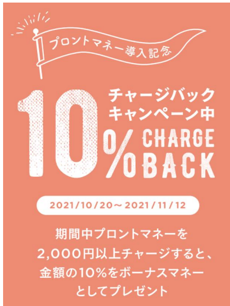
導入記念キャンペーン中

※キャンペーン期間中は、通常のチャージバック特典（3,000円以上のチャージで金額の3～7%をボーナスマネーとしてプレゼント）は適用されず、本キャンペーンのボーナスマネーのみプレゼントいたします。