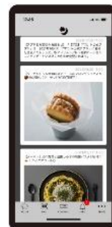
【POINT3】 お知らせが 届く