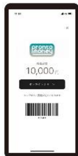
【POINT1】 プロントマネーが 使える

「プロントマネー」導入に伴いリニューアルした「プロント公式アプリ」では、「プロントマネー」をご利用頂けるだけでなく、メニュー情報やクーポン、様々な情報をお届けいたします。