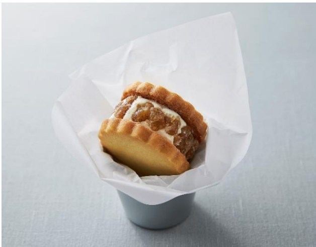
「バターサンド ラムマロン 380円（税込418円）」

株式会社プロントコーポレーション（本社：東京都港区、代表取締役社長：竹村典彦）は、9月16日より全国の「PRONTO（プロント）」 *1 のカフェタイムにて、「バターサンド ラムマロン」と「真っ赤なりんごレアチーズ」を新発売いたします。プロントは、お客様に安全・安心にご利用していただけるよう、新型コロナウイルス感染拡大防止策をしっかりと行うとともに、ご来店いただくお客様がより楽しんで頂ける商品やサービスを今後も提供して参ります。