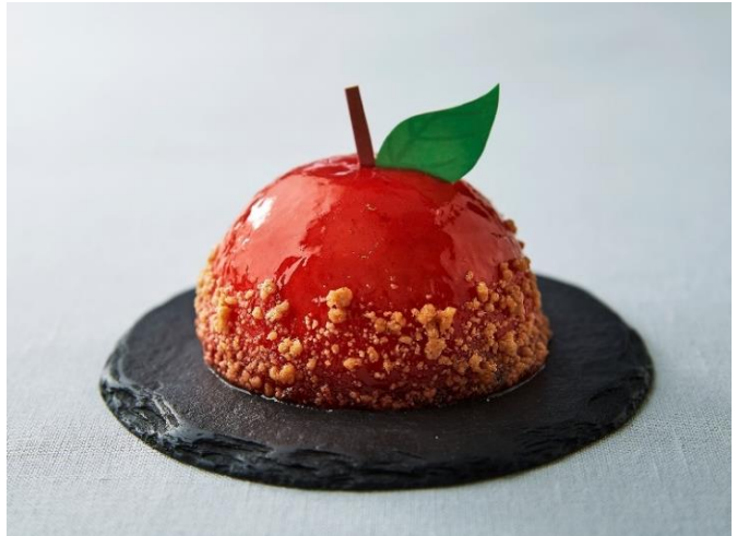
「真っ赤なりんごレアチーズ 530円（税込583円）」

「バターサンド ラムマロン」は、バター香るしっとりクッキー生地にラム酒風味のクリームとマロングラッセをサンドしました。コーヒーと相性の良い、お土産にもぴったりのバターサンドです。「真っ赤なりんごレアチーズ」は、スポンジケーキ、カラメルりんごとレアチーズムースに真っ赤なナパージュを流しかけ、シナモンクランブルをトッピング。見た目も味も、りんごを存分に楽しめるレアチーズケーキです。