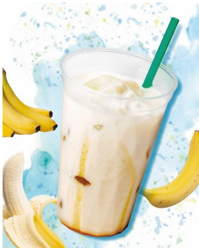
生はちみつのバナナミルク M 440円(+税) XL 540円(+税)

株式会社プロントコーポレーション（本社：東京都港区、代表取締役社長：竹村典彦）は、7月13日（月）より全国の「カフェ&バー プロント（以下、プロント）」のカフェタイムにて、夏の新メニューの販売を開始いたします。