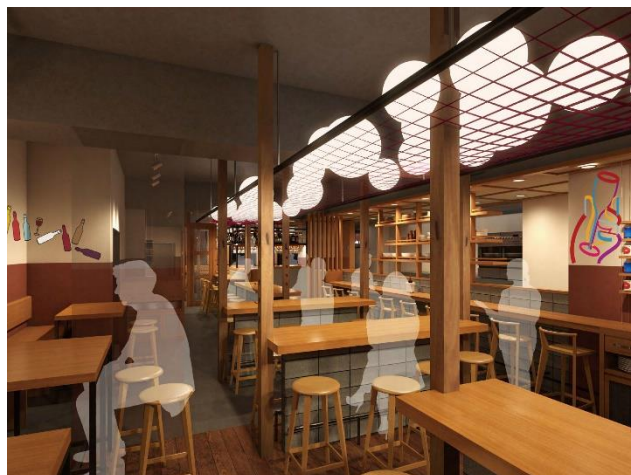
ワインの酒場。Di PUNTO 浦和店の内観

今後もディプントは、お客様の暮らしを豊かにするために、日常使いのできる、“気軽なワインの酒場”として、バラエティ豊富なワインと食事を提供する業態として、全国に展開して参ります。