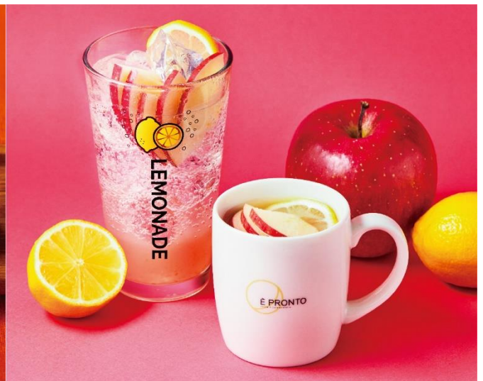
「アップルジンジャーレモネード（アイス/ホット）」

今回新登場する「カニコロドッグ～紅ズワイチーズタルタル～」は、エプロントの人気商品グルメドッグシリーズの最新作で、昨年好評だった「カニコロドッグ」をさらに美味しくさせた一品です。「アップルジンジャーレモネード」は全国のエプロントで働くスタッフを対象に開催された『レモネードコンペティション』にて、ルミネ立川店のスタッフが考案した入賞作品です。同年3月から販売されていた商品化第1弾の入賞作品「フルーツティーレモネード」が非常に好評だったため、この度、商品化第2弾として販売することになりました。