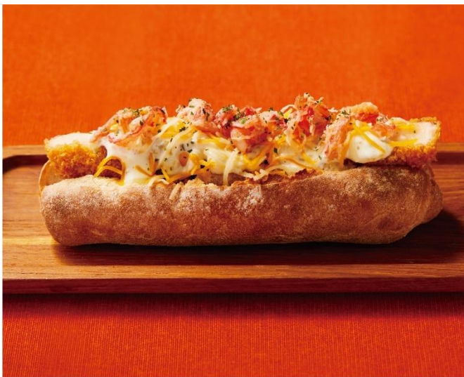
「カニコロドッグ～紅ズワイチーズタルタル～」

株式会社プロントコーポレーション（本社：東京都港区、代表取締役社長：杉山和弘）は、10月3日(火)より全国の「È PRONTO（エプロント）」 ※1 にて、毎年人気の季節限定グルメドッグをリニューアルした「カニコロドッグ～紅ズワイチーズタルタル～」や店舗スタッフ考案の「アップルジンジャーレモネード」などの新メニューが登場いたします。