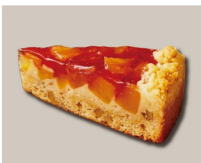
「りんごとくるみのクランブルケーキ」520円