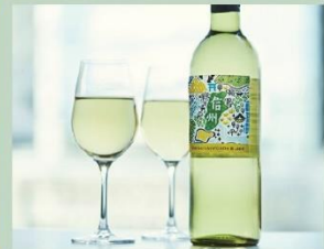
信州産ソーヴィニヨン・ブラン (Di PUNTO)

プロントグループでは、サステナビリティ活動として4つの「人・海・資源・森」の領域を守る活動を行っています。今後、SDGs（持続可能な開発目標）におけるサステナブルな社会作りを目指した企業として、また、各サステナビリティ活動を通じ、日本緑化活動・次世代の子供たちへの支援を継続して実施してまいります。