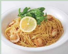
旨味きのこの香りバター (È PRONTO)