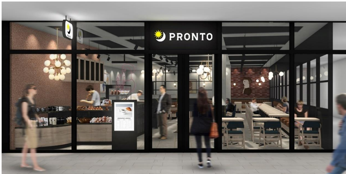
カフェタイム外観イメージ

株式会社プロントコーポレーション（本社：東京都港区、代表取締役社長：杉山和弘）は、11月29日（水）に「PRONTO ららテラスTOKYO-BAY店（以下、プロント）」をオープンいたします。