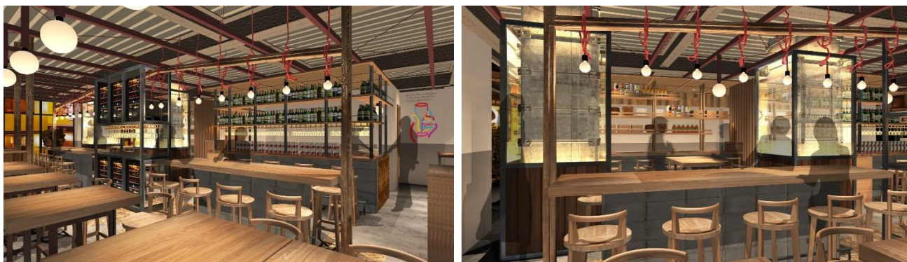
ワインの酒場。Di PUNTO 佐賀駅店の内観イメージ