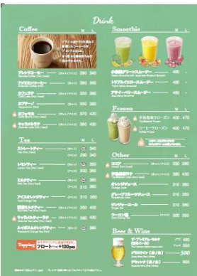
カフェタイム メニュー