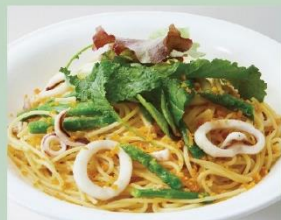
バター香るイカとアスパラのからすみ風味 (È PRONTO)