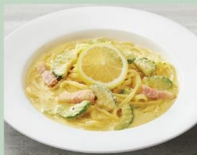
ズッキーニの塩レモンカルボナーラ (PRONTO)