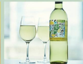
信州産ソーヴィニヨン・ブラン (Di PUNTO)

プロントグループでは、サステナビリティ活動として4つの「人・海・資源・森」の領域を守る活動を行っています。今後、SDGs（持続可能な開発目標）におけるサステナブルな社会作りを目指した企業として、また、各サステナビリティ活動を通じ、日本緑化活動・次世代の子供たちへの支援を継続して実施してまいります。